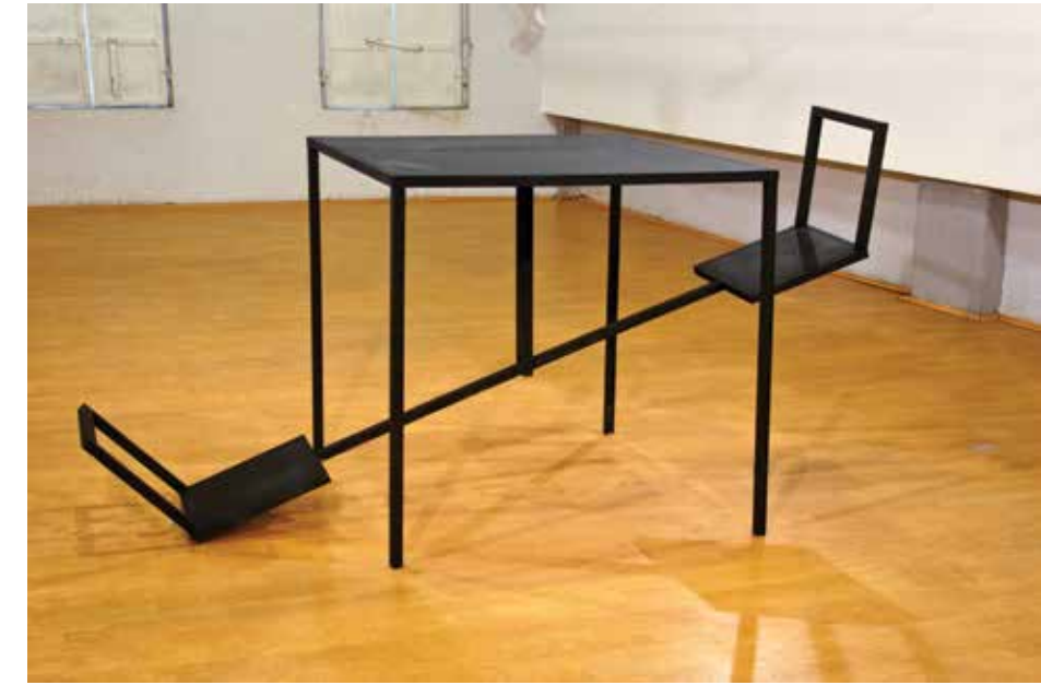
Маса за играње, 2015, инсталација Play Table, 2015, an installation