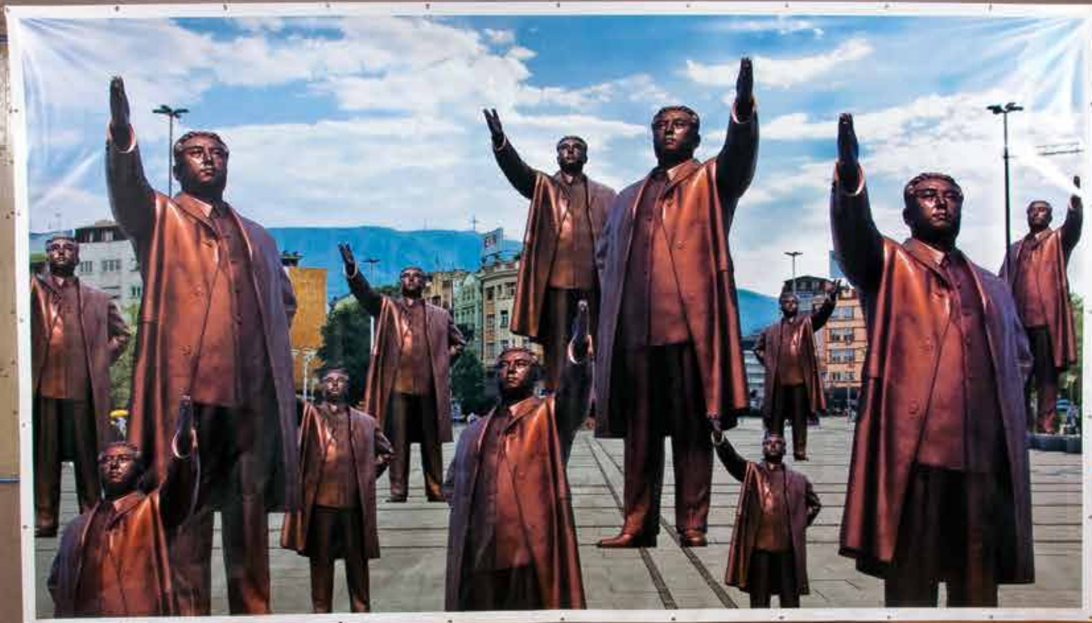
Визионер, 2009, дигитален печат, 226 x 400 см. A Visionary, 2009, digital print, 226 x 400 cm.