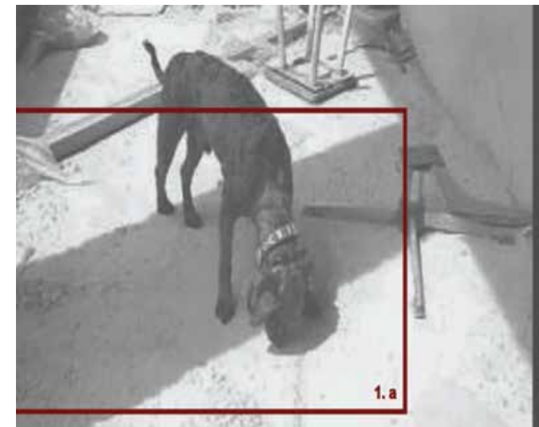
Наемни работници, видео и инсталација со училишни столчиња Daily Workers, video and installation with school chairs