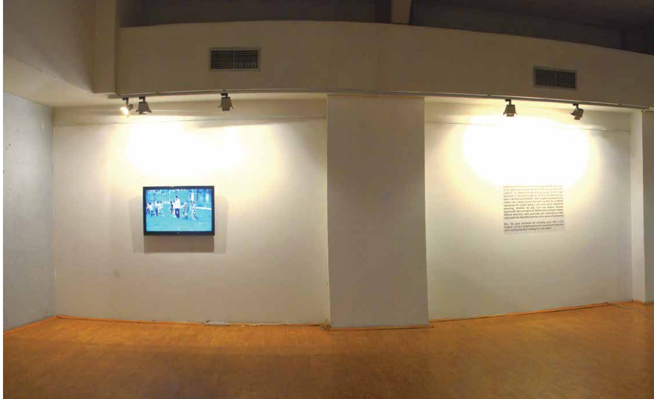
Кој е господарот? (Сакате ли војна), 2011, видео Who is the Landlord?, 2011, video

But... the game transcends the preceding story. 'Who is the landlord' is, in fact, symbolic and is in this way related to each time and to each society that is seeking for a new utopia.